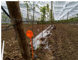
PRUMEL Plastique biodégradable.jpg