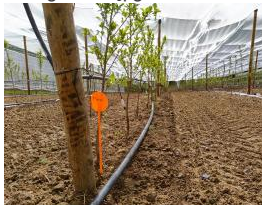
PRUMEL entretien mécanique.jpg