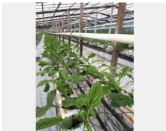
Germini - Plantation