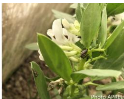
Plante de service : fève et larves de coccinelle