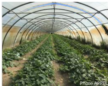
Site APREL - AGRECOMEL - tunnel de melon