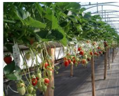
Fraise hors sol - sol bachelé