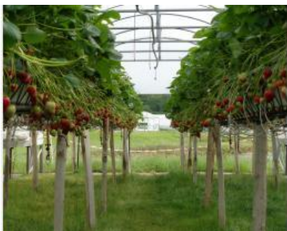
FragaSyst - site Invenio Douville