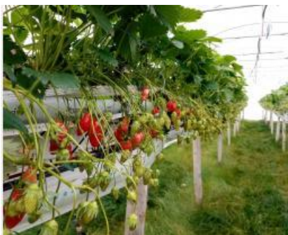
Fraise hors sol - enherbement au sol