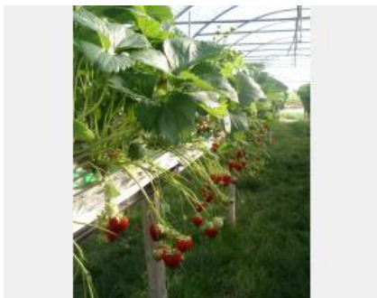
Invenio - FragaSyst fraises et enherbement