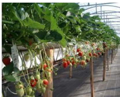
Fraise hors sol - sol baché