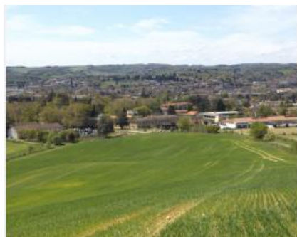
La Hourre 2016