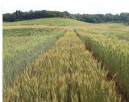
Ble feverole 2017