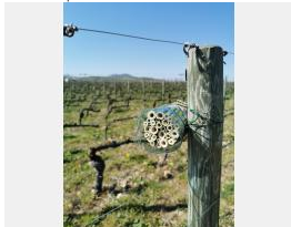
Nichoïr abeilles sauvage Beaujolais