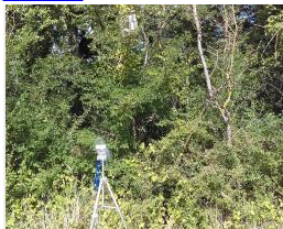
Capteur ultrasons chauve souris