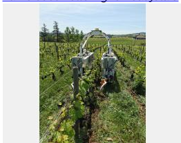
Robot TED vigne Beaujolais