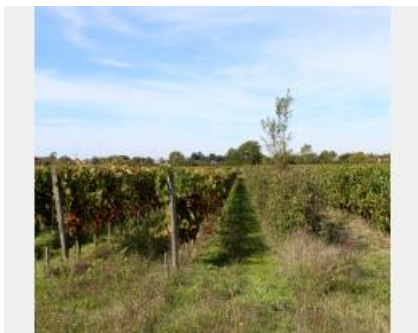
Haies intra-parcellaires sur ResIntBio