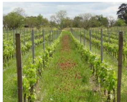
Enherbement du sol sur ResIntBio