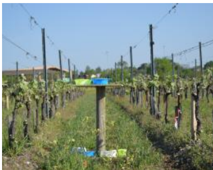
Cuvettes colorées - pollinisateurs