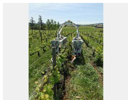
Robot TED vigne Beaujolais