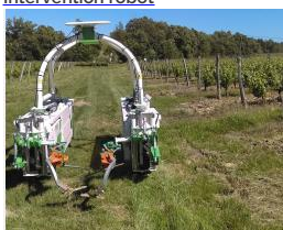
Robot avec intercepts