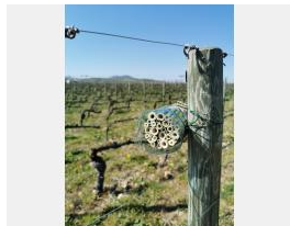
Nichoир abeilles sauvage Beaujolais