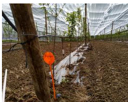
PRUMEL Plastique biodégradable.jpg