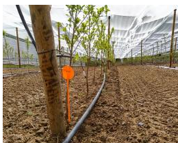
PRUMEL entretien mécanique.jpg