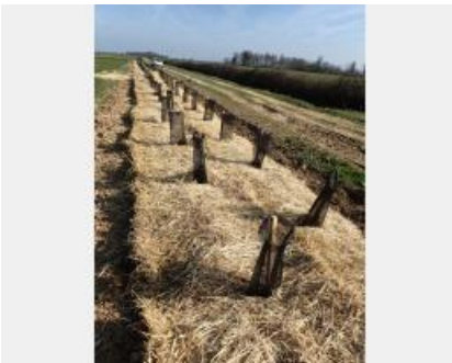
Jeune plantation de haie en bordure de parcelle