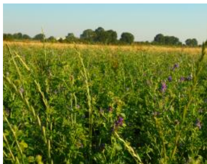
Luzerne avant fauche