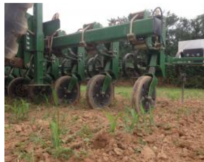
Binage du sorgho