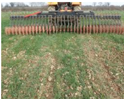
Houe rotative sur blé