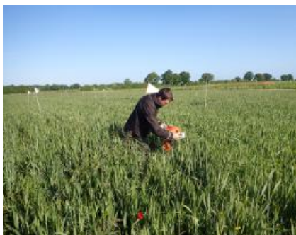
Suivi des populations de pucerons et de leurs régulations biologiques