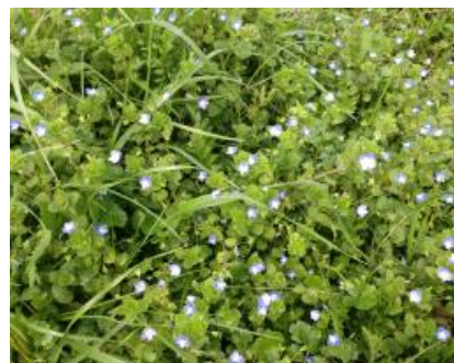
Véronique en fleurs