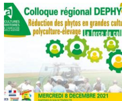
Colloque DEPHY_RES0PEST LUSIGNAN_2021.pdf