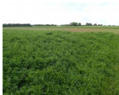
Vue du dispositif