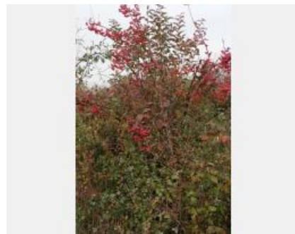
Haie champêtre en bordure de parcelle