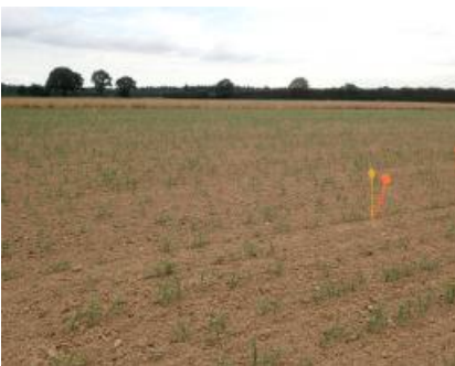
Placettes d'observation dans une parcelle de sorgho