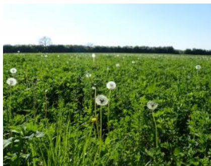
Prairie à base de luzerne