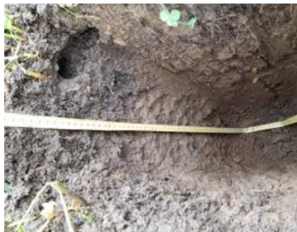
profil de sol mars 2020