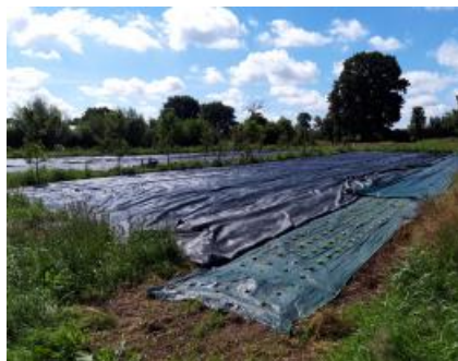
Parcelle en juillet 2020