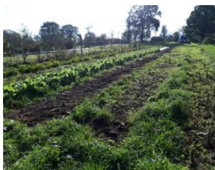
Parcelle en mai 2020