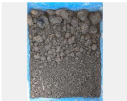
Séparation des mottes par taille