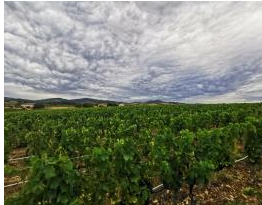
Parcelle Next Gen Viti Beaujolais