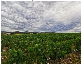
Parcelle Next Gen Viti Beaujolais