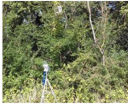
Capteur ultrasons chauve souris