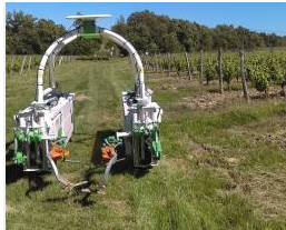
Robot avec intercepts