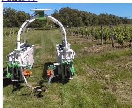
Robot avec intercepts