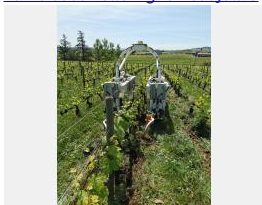
Robot TED vigne Beaujolais