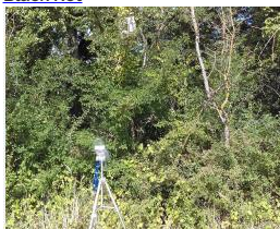
Capteur ultrasons chauve souris