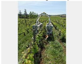
Robot TED vigne Beaujolais