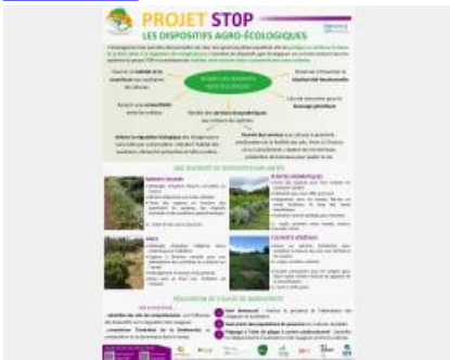
Poster Projet ST0P Les dispositifs agro-écologiques