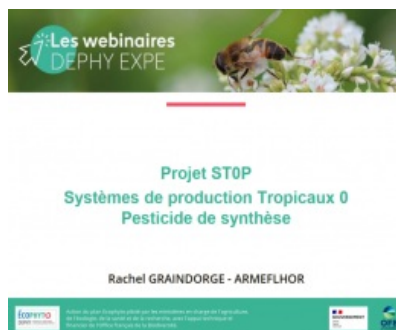
Présentation webinaire DEPHY EXPE projet SToP - Diversifier les cultures pour une meilleure résilience des systèmes