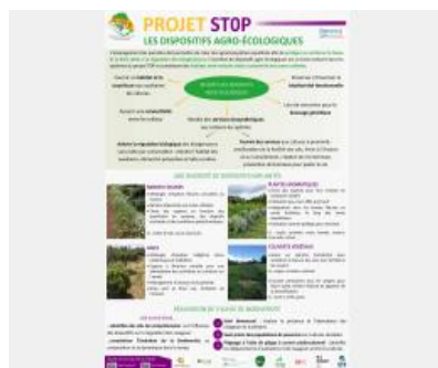
Poster Projet SToP - Les dispositifs agro-écologiques