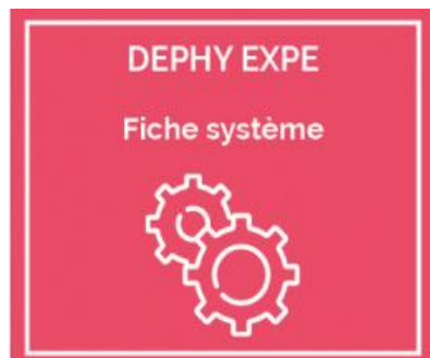
Présentation SToP - Systèmes de production Tropicaux 0 Pesticide de synthèse