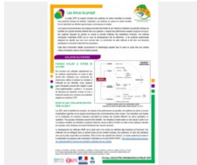
Lettre d'informations n°4 SToP