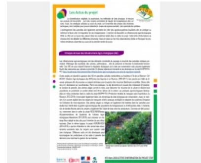
Lettre d'informations n°3 SToP