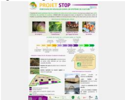
Poster Projet ST0P Parcours de volailles dans un système de culture