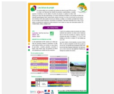
Lettre d'informations n°2 SToP