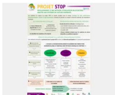
Poster Projet SToP - Développement d'une méthode d'évaluation multicritères adaptée aux SdC diversifiés