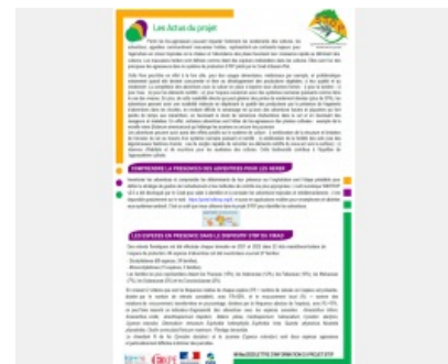
Lettre d'informations n°6 SToP adventices et désherbage.pdf