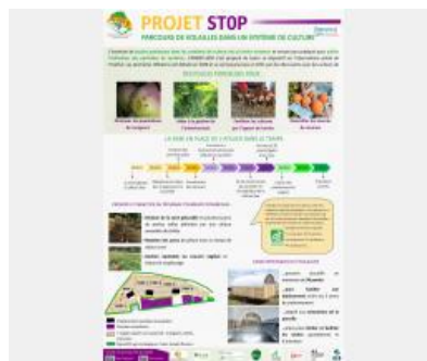
Poster Projet SToP - Parcours de volailles dans un système de culture