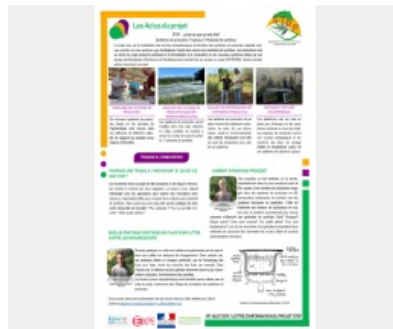
Lettre d'informations n°1 SToP