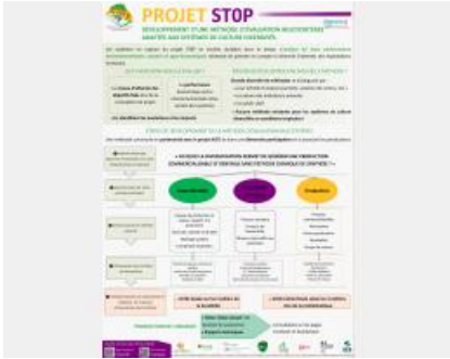
Poster Projet ST0P Développement d'une méthode d'évaluation multicritères adaptée aux SdC diversifiés