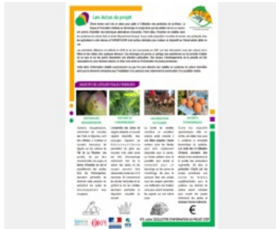
Lettre d'informations n°5 SToP