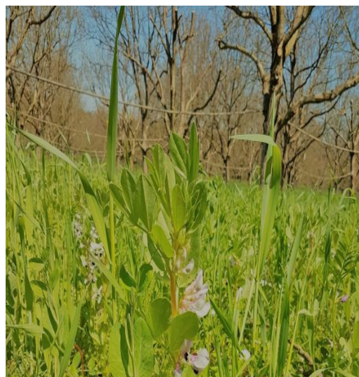
Site Franquette en 2019: développement des couverts végétaux (SENUra)

Les deux systèmes Sys'NOIX, évolutifs dans le temps sont constitués d'un ensemble de leviers d'action appliquant les principes de la protection agroécologique des cultures pouvant être classés en cinq catégories : aménagement favorisant la lutte biologique par conservation (couverts végétaux, noisetiers sur les rangs de noyer...), prophylaxie (broyage des feuilles en hiver...), méthode culturale (taille sévère pour aérer le verger, optimisation de l'irrigation...) évaluation des risques (pièges connectés, suivi des modèles de risque à la parcelle) et technique de substitution aux produits phytosanitaires (confusion sexuelle, piégeage massif).