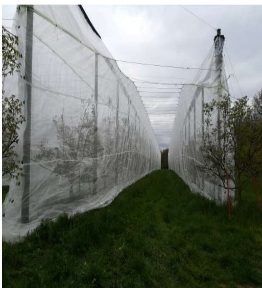
Site Lara en 2019 après la mise en place des bâches anti-pluies et des filets anti-insecte monorang (SENuRA)

Pour le système testé sur la variété Lara, ces leviers sont jugés insuffisants. En effet, ces systèmes intensifs se dirigent vers une augmentation des IFT, pour juguler les problèmes émergents tels que la mouche du brou ou le Colletotrichum. C'est pourquoi, inspiré par les expériences en pomme ou en cerise, sur cette parcelle un dispositif de bâches anti-pluie et de filets anti-insectes a été mis en place. Cependant, ce dispositif, sur des arbres de haut jet tel le noyer pouvant monter à plus de 15m, nous amène à repenser en profondeur notre vision du verger nucicole.