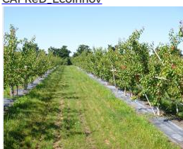
Eco-Innov - CAPReD