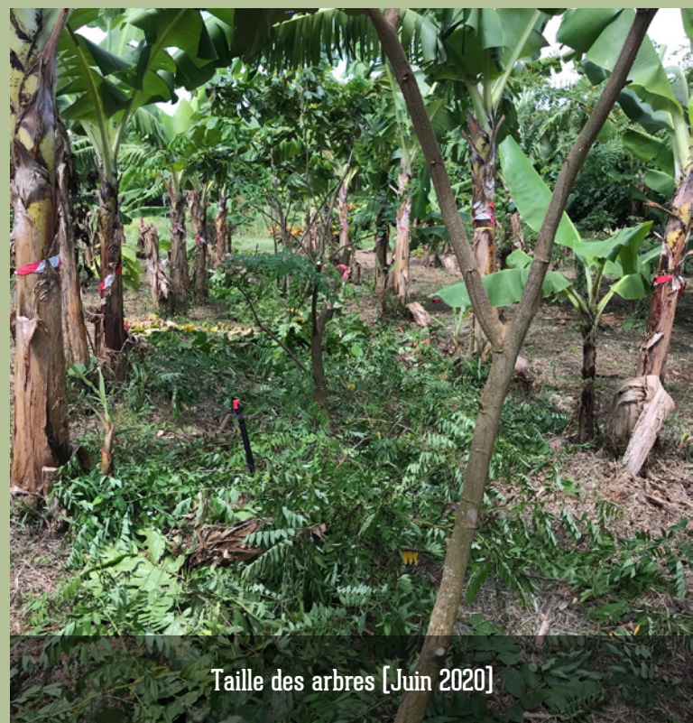
Taille des arbres [Juin 2020]

En revanche, ce carême marqué a fortement limité le développement de la cercosporiose, ce qui nous permet d'aborder la récolte du 2 nd cycle dans de très bonnes conditions de remplissage des régimes. Ces récoltes ont débuté fin juillet et montrent pour le moment des régimes de taille importante et sans aucun défaut, en particulier sur les parcelles conventionnelles.