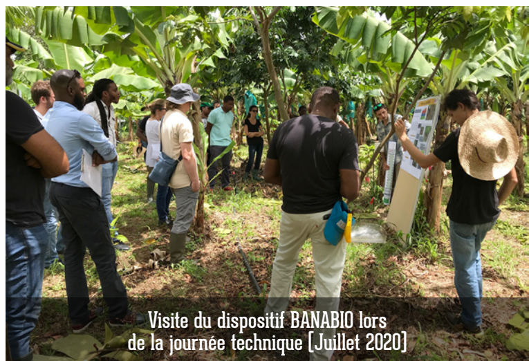
Visite du dispositif BANABIO lors de la journée technique [Juillet 2020]

Comme pour l'ensemble des projets DEPHY EXPE, une page Projet pour BANABIO peut être consultée à l'adresse suivante : http://ecophytopic.fr/concevoir-son-systeme/projet-banabio