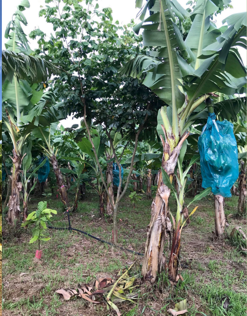
Parcelle BD, avec cacaoyer et pois doux [ Inga ingoides ] à la récolte du 2 nd cycle [Août 2020]