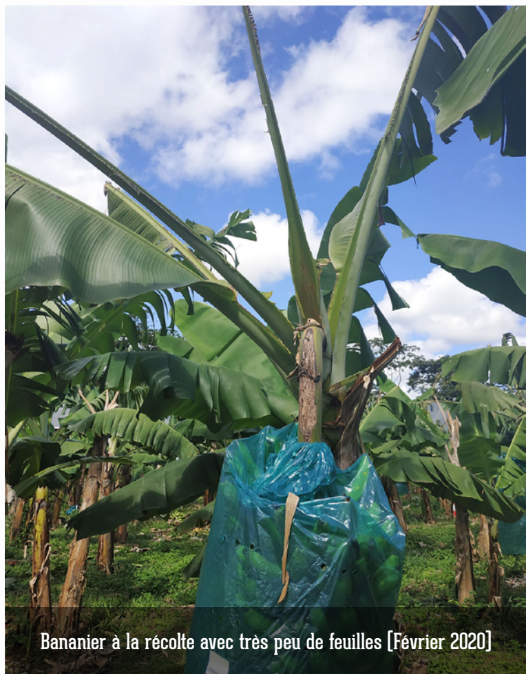
Bananier à la récolte avec très peu de feuilles [Février 2020]

En revanche sur les régimes récoltés sains, les durées de vie verte [durée de conservation des fruits avant leur mûrissement naturel] ont été assez élevées, 40 jours en moyenne, quel que soit le système considéré.