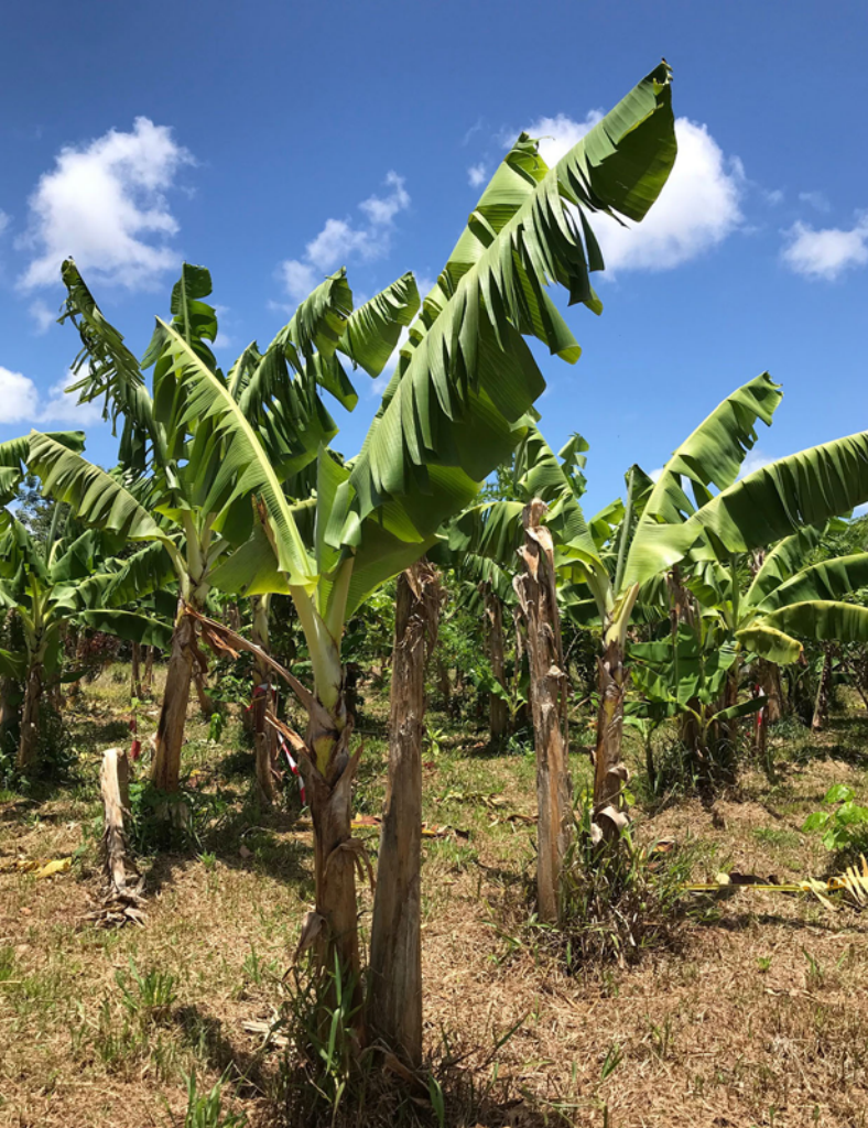
Parcelle BI avec croissance réduite due à la sécheresse [Mai 2020]