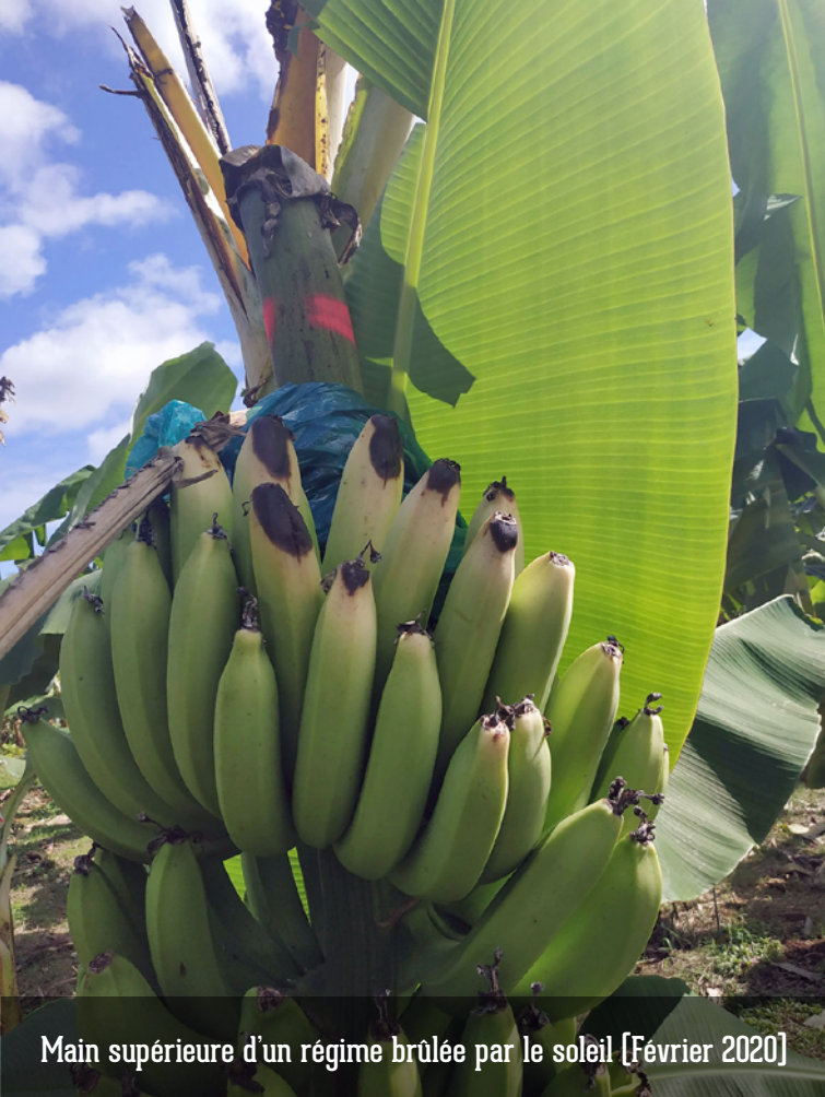
Main supérieure d'un régime brûlée par le soleil [Février 2020]