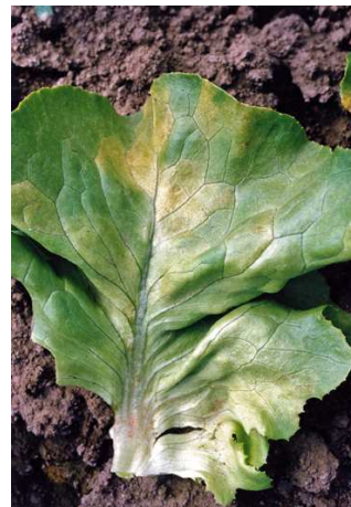
Attaques de bremia sur salades