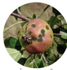
Tavelure - FREDON NA