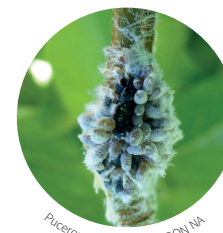
Pucerons lanigères - FREDON NA