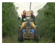
La Morinière - FREDON NA

Autres sujets abordés : Fertilité du sol, qualité de pulvérisation, gestion des adventices