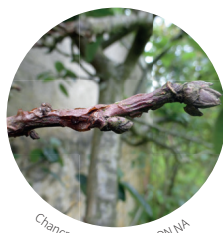
Chancres à nectria - FREDON NA