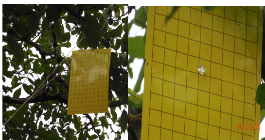
Plaques M21 pour le piégeage massif avec phéromones