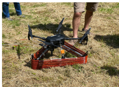
Pose de Ginko Ring par Drone